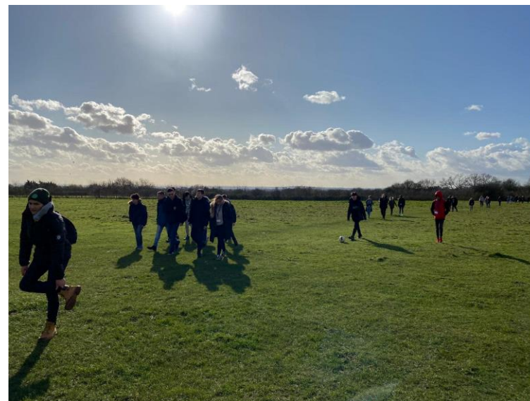
Activități sportive: indoor și outdoor