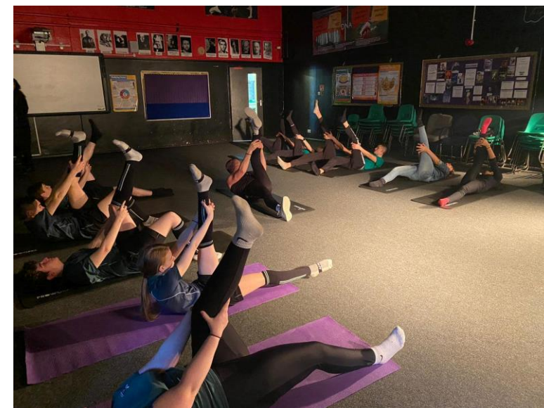
Dezvoltare fizică personală